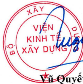
Vũ Quyết Thắng